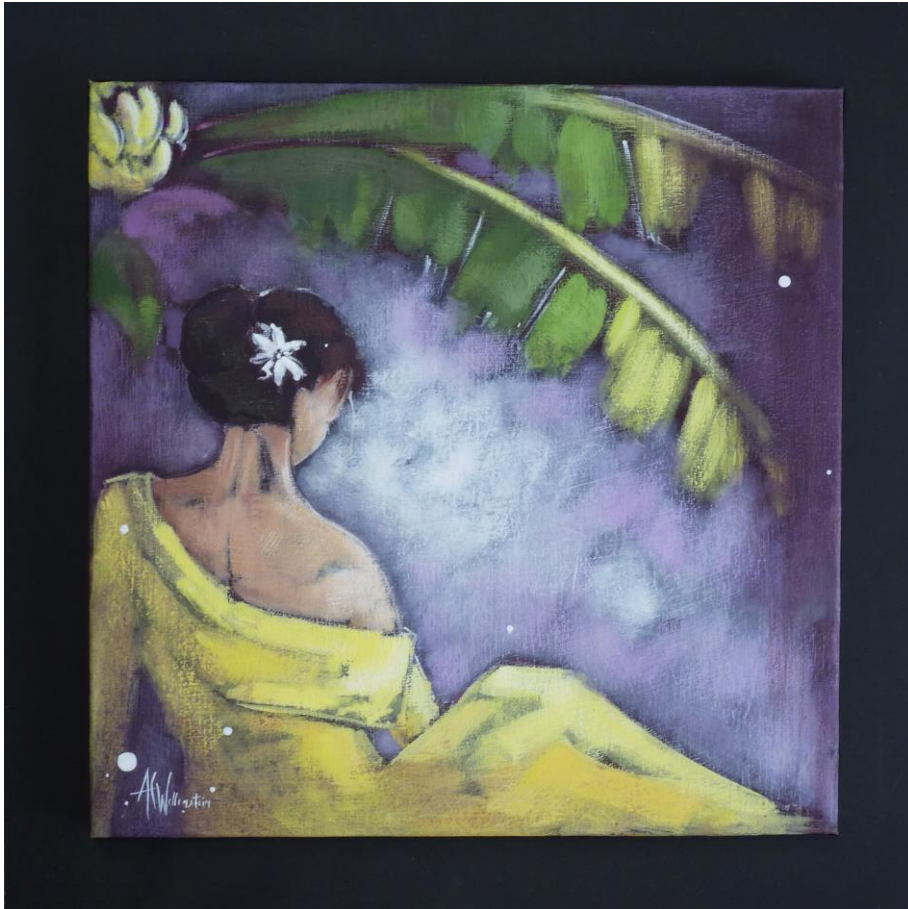
« La muse »